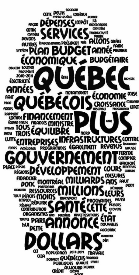
2. Les mots du Discours sur le budget 2010-2011 (sous Wordle)

À quand une politique budgétaire plus attentive aux déficits humains et moins exposée aux «taxages», autrement dit aux pressions indues, d'une minorité qui concentre à son profit la richesse collective ?