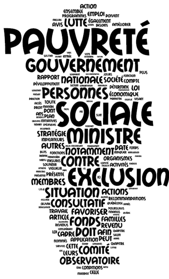
1. Les mots de la Loi visant à lutter contre la pauvreté et l'exclusion sociale (sous Wordle)